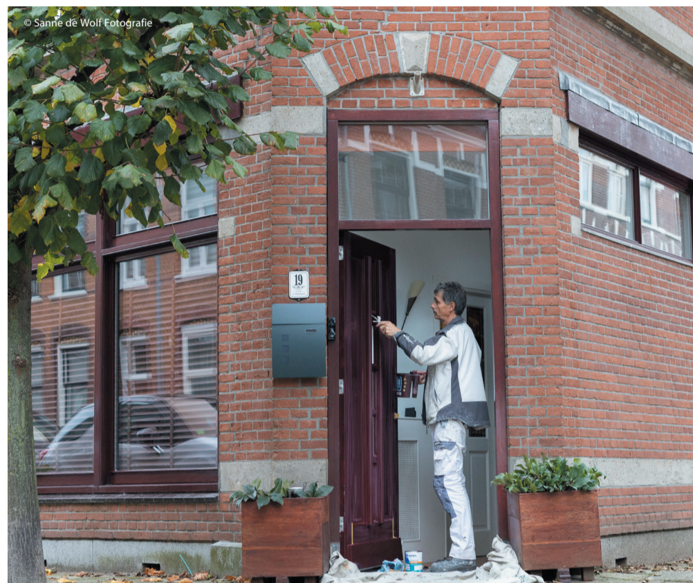
• UIT DE WIJK

de garenkoker www.garenkokerskwartier.nl